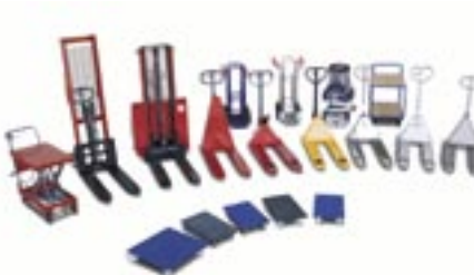
Interne transport middelen